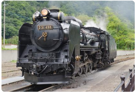
D51498 の新潟での実物写真