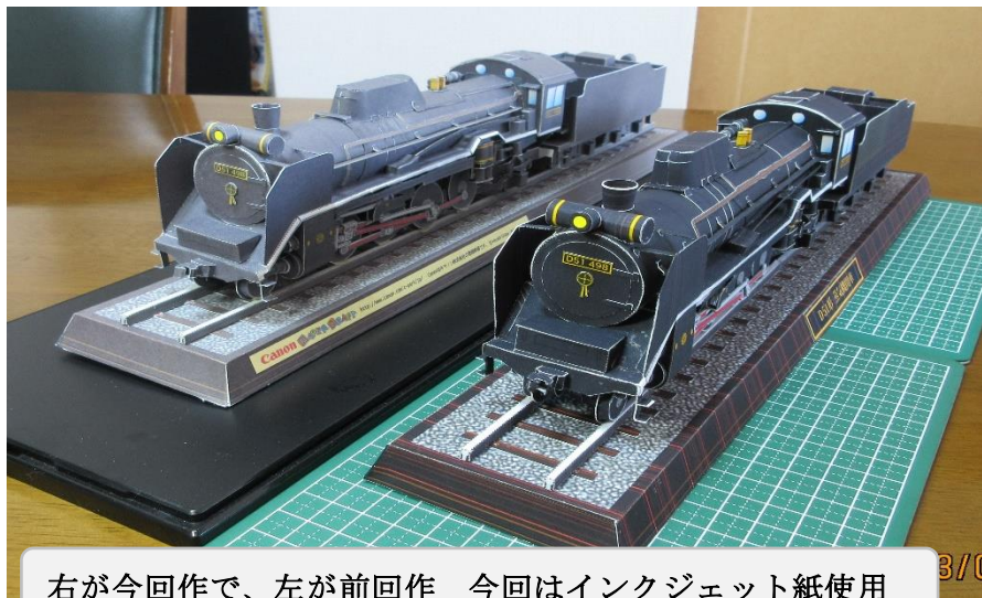
右が今回作で、左が前回作 今回はインクジェット紙使用