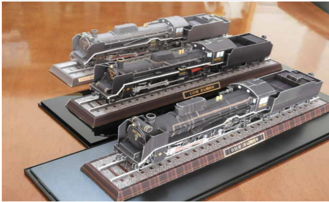
手前が今回作 中央 C57 貴婦人 奥は前回作D51 三両並ぶと壮観 全長 41センチ キャノンに感謝