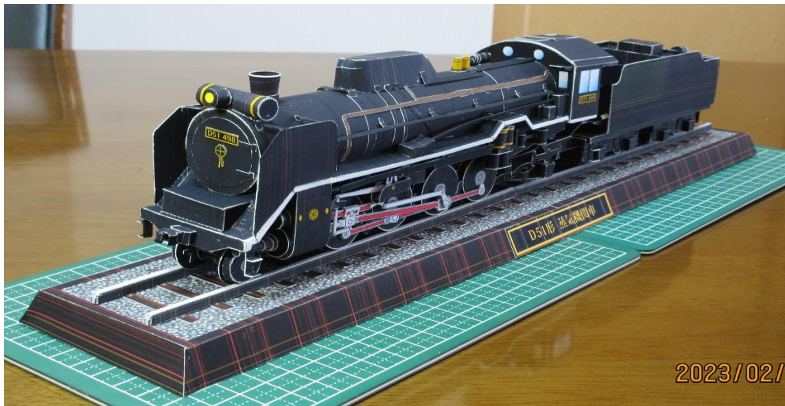
2月3日 前回に比べ、傾きもずれもないので台座に綺麗に乗り、安心しました！