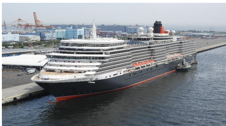
総トン数 90,901トン、全長294m、乗客2,081人