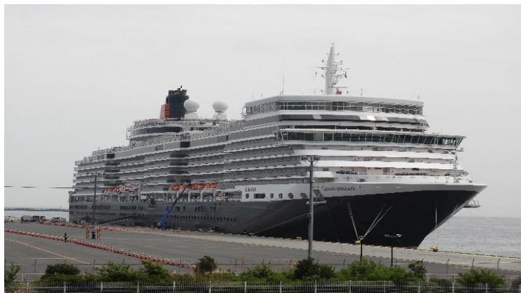
横浜港 大黒ふ頭に着岸したクイーン・エリザベス