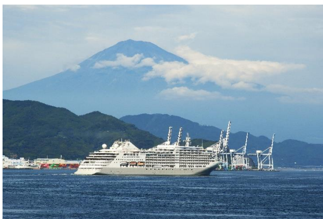
富士を左舷に見ながら清水港にお別れ