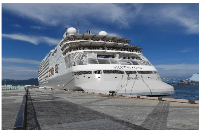
モナコ(運営)の船は船尾も曲線が奇麗でオシャレ