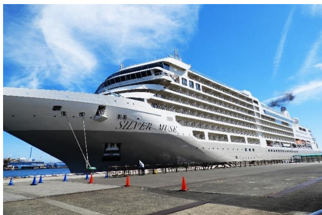
40,700トン 全長212m 幅27m 乗客596人 船籍パナマ

2017年4月に就航。大気および水質汚染防止装置を備えたモナコの全室スイート仕様豪華客船です。 (11:00 自宅出発→12:30 清水港→13:15 シルバーミュージズ出航→14:30 清水港で昼食→16:30 帰着)