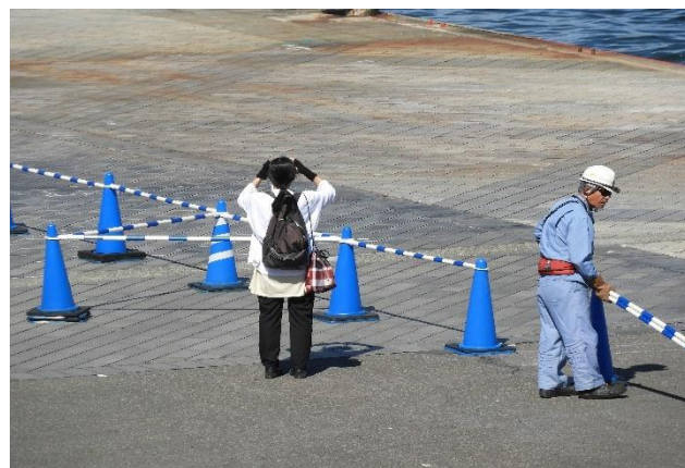
おじさん片付け 最後まで撮影する女性見事です！

シルバーミュージズは船首と船尾の横にもスクリュウがありタグボートの補助なしで離岸します。長笛を3度鳴らし静かに自力で離岸する姿はまさに「美」です。船内から外国人が手を振り日本語で「さよなら」と叫び、埠頭からも「さよなら」と手を振って応えます。なんとなく船旅特有の物悲しくなる瞬間です。いつの日か外国船に乗って手を振りながら「さよなら」と叫んでみたいものです。ボンボヤージュ。