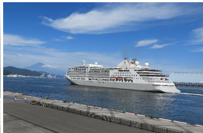
離岸後前進 昨日は横浜、これから大阪港に向かう